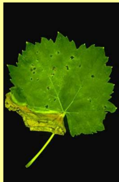
Slika 1. Pegavost i nekroza oboda lista