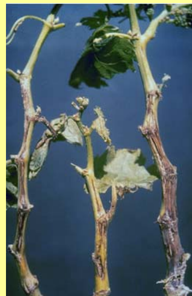
Slika 3. Nekroza lastara u okviru kojih tkivo puca